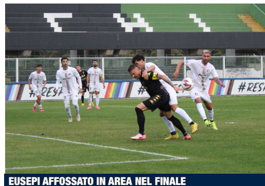
EUSEPI AFFOSSATO IN AREA NEL FINALE

frazione di gioco che si chiude con i rossoblù che sfiorano nuovamente il gol del vantaggio con un colpo di testa di Zini terminato di poco a lato. Il match riprende con il Chieti che cerca di mettere sotto pressione i rossoblù sin dai primi minuti. La Samb soffre e al 13' corre un clamoroso pericolo: un brutto errore di Zini permette a Forgione di calciare indisturbato dall'interno dell'area con la palla che, però,